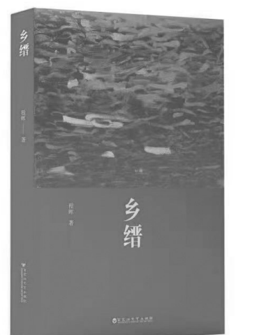
《乡绅》,程晖著,百花洲文艺出版社2022年1月出版,50.00元

独特的微观元素作为“血肉”。比如,故事主要发生地点——高安县龙湾村,其优美的自然风光四季交替、昼夜晨昏阴晴冷暖,宏大精美、整齐严谨的赣派建筑和村落布局,它的城山山川、农业丰收、圩集贸易、牛市谈价,在中共游击队与进步乡绅领导下的几次抗洪抢险救灾,以及当地独有的方言、美食、酿酒、服饰、用品、土特产、采茶戏、花鼓戏、节气活动、红白喜事、工艺制作、书法绘画、历代名人、传说故事、姓氏渊源、先祖迁徙……都在该小说里有丰富而充分的展示。