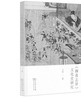
《〈聊斋志异〉文化史研究》，王昕著，商务印书馆2021年5月第一版，89.00元

从整体上看，本书既有宏观的理论探讨，也有微观的个案考察。本书的优长之处还在于，既不缺少