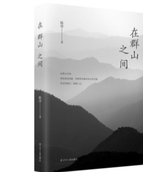
《在群山之间》，陈涛著，辽宁人民出版社2021年7月第一版，49.80元

现实，将个人命运与自然、人群、集体和国家交融交织，既有对外部世界时代现实的关切意识，又有内部世界谛视心灵的哲理式探讨，从而弥合了个人化与公共性之间的裂缝。事实上，从自我的日常生活感受出发，以实际行动关心远方无数人的命运，将自我的奋斗和青春与整个时代和时代的进程联系起来，这是《在群山之间》独特的书写路径。循此路径，陈涛的散文写作在内容、情感、审美、形式等方面进行了诸多的探索和有益的尝试。更为重要的是，随着理想主义和集体主义的昨日重现，陈涛在该部散文中重新召回了古典文学中“文以载道”的传统，明确张扬“为人生”文学的复归。