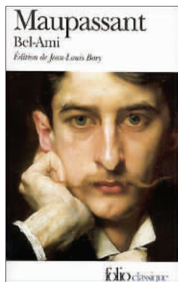
《漂亮朋友》法文版书影

晚期梅毒不但使得莫泊桑头发脱落、记忆丧失,更严重的是使他成为一个躁狂忧郁症患者。躁狂发作时,他情绪激烈,异常兴奋,什么事都做得出来;忧郁时就悲观厌世并伴有幻想。这两种状态交叉出现。1891 年 12 月 15 日,他给诗人朋友昂利·卡扎利斯写信,清醒地说自己