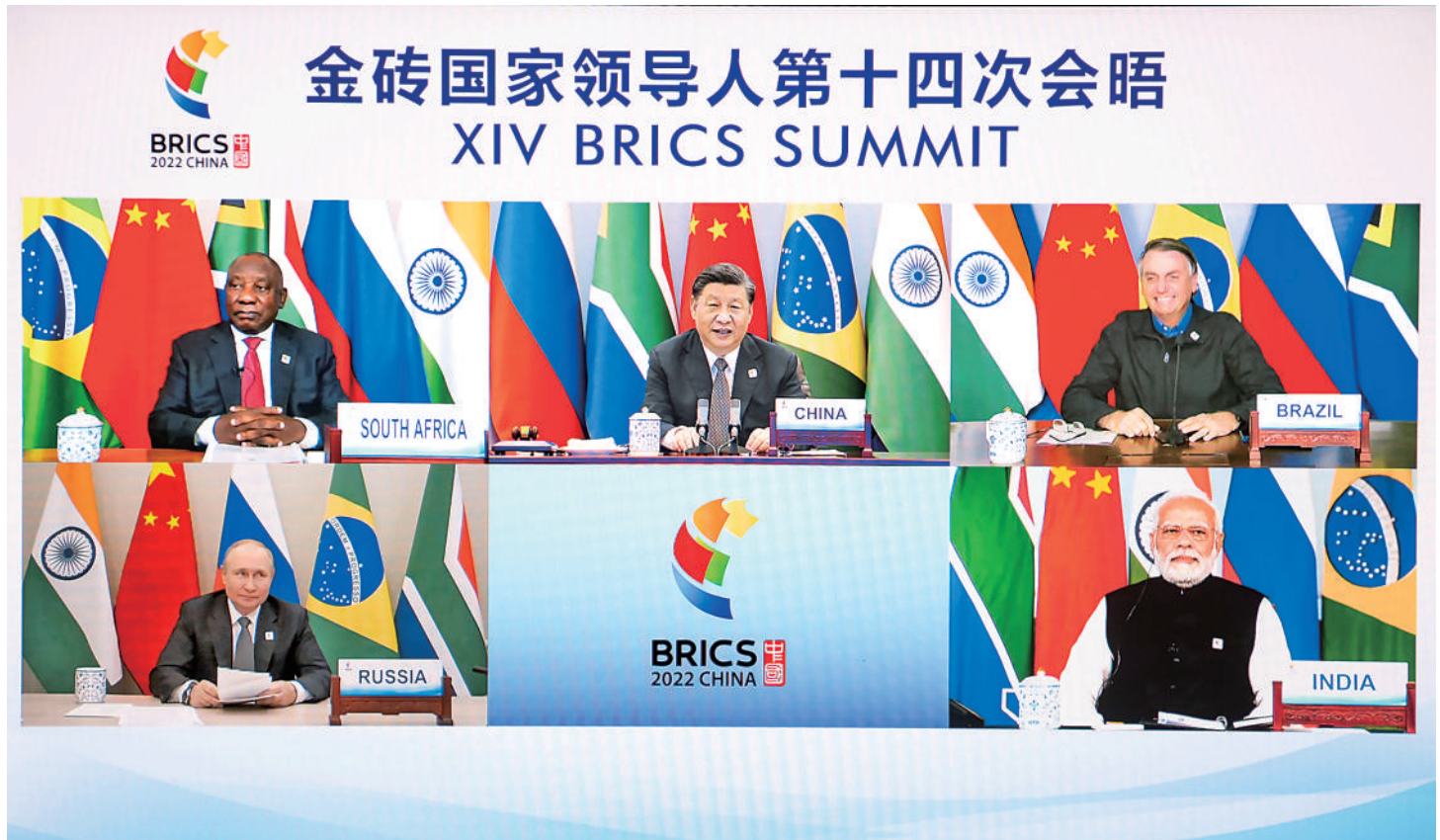
6月23日晚,国家主席习近平在北京以视频方式主持金砖国家领导人第十四次会晤并发表题为《构建高质量伙伴关系 开启金砖合作新征程》的重要讲话。南非总统拉马福萨、巴西总统博索纳罗、俄罗斯总统普京、印度总理莫迪出席。

新华社北京6月23日电(记者杨依军)国家主席习近平23日晚在北京以视频方式主持金砖国家领导人第十四次会晤。南非总统拉马福萨、巴西总统博索纳罗、俄罗斯总统普京、印度总理莫迪出席。