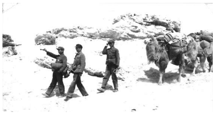
考古调查队徒步向楼兰行进

现代意义的楼兰研究,应当始于1900年瑞典探险家斯文·赫定对楼兰的考古发掘。1903年,他的纪实性行记的英文本《中亚与西藏》出版;随后在1904至1907年间,他又编写了八卷本的《1899—1902年中亚旅行的科学成果》,引发了普通读者和专业学者对楼兰和罗布泊的兴趣。1906年,英国考古学家斯坦因奔赴楼兰,赶在他推测的其他探险队到来之前,系统调查、发掘了楼兰地区大部分城址和墓葬。1912年,他先出版了两卷本的个人旅行记《沙埋契丹废墟记》;然后在1921年,又出版了五卷本的正确考古报