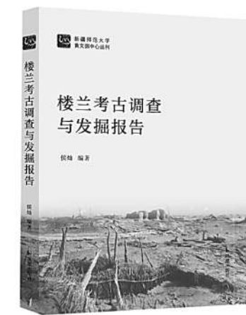
《楼兰考古调查与发掘报告》 侯灿 编著 凤凰出版社