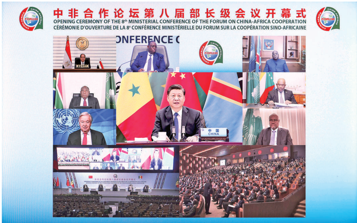
11月29日晚,国家主席习近平在北京以视频方式出席中非合作论坛第八届部长级会议开幕式并发表题为《同舟共济,继往开来,携手构建新时代中非命运共同体》的主旨演讲。