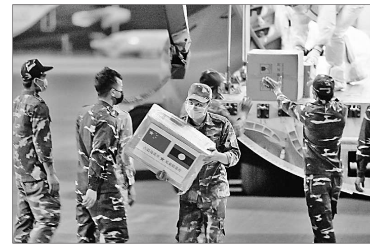
▲11月23日,老挝人民军官兵在万象瓦岱国际机场搬运中国军队援助的抗疫物资。