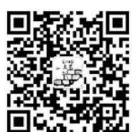
更多雅趣,扫码可知。