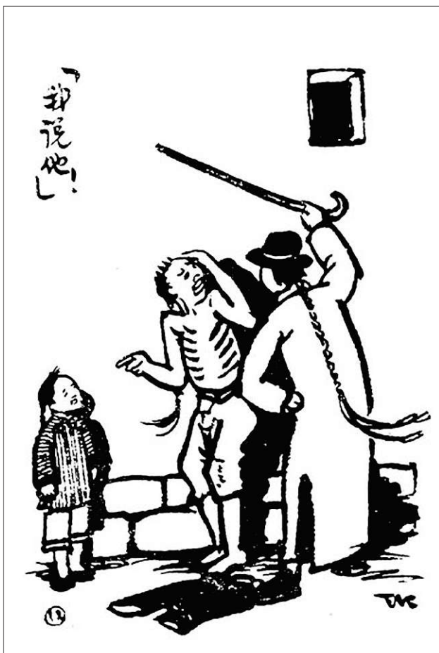
丰子恺绘《阿Q正传》插图 资料图片