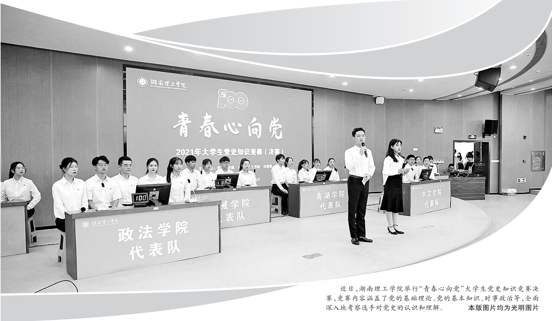
近日,湖南理工学院举行“青春心向党”大学生党史知识竞赛决赛,竞赛内容涵盖了党的基础理论、党的基本知识、时事政治等,全面深入地考察选手对党史的认识和理解。