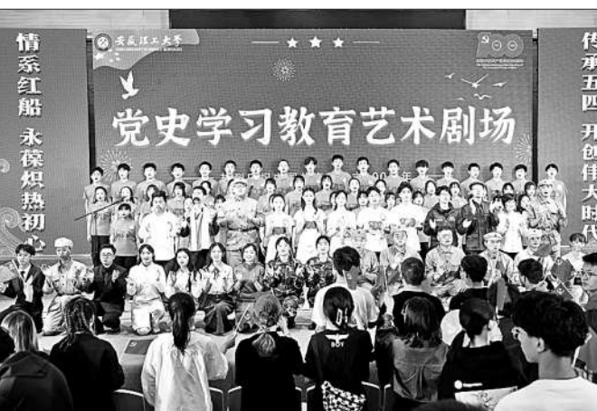
安徽理工大学创新党史学习教育新形式,师生以情景朗诵等艺术形式,精彩再现中国共产党百年奋斗史中的光辉事迹。