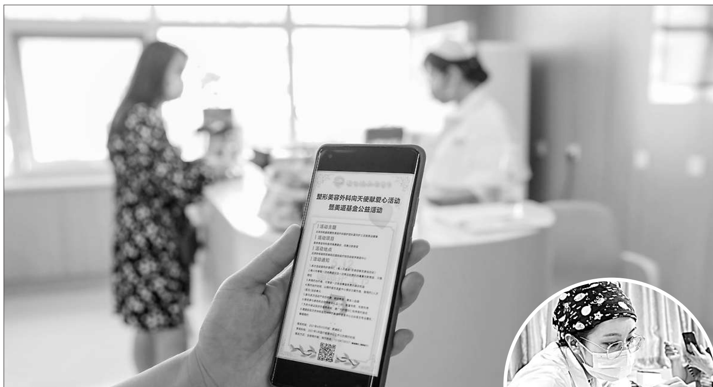
▲北京协和医院整形美容外科医生团队和南丁格尔护理志愿服务队,在“医美送健康”主题公益活动上为护理从业者提供暖心的健康医美体验。