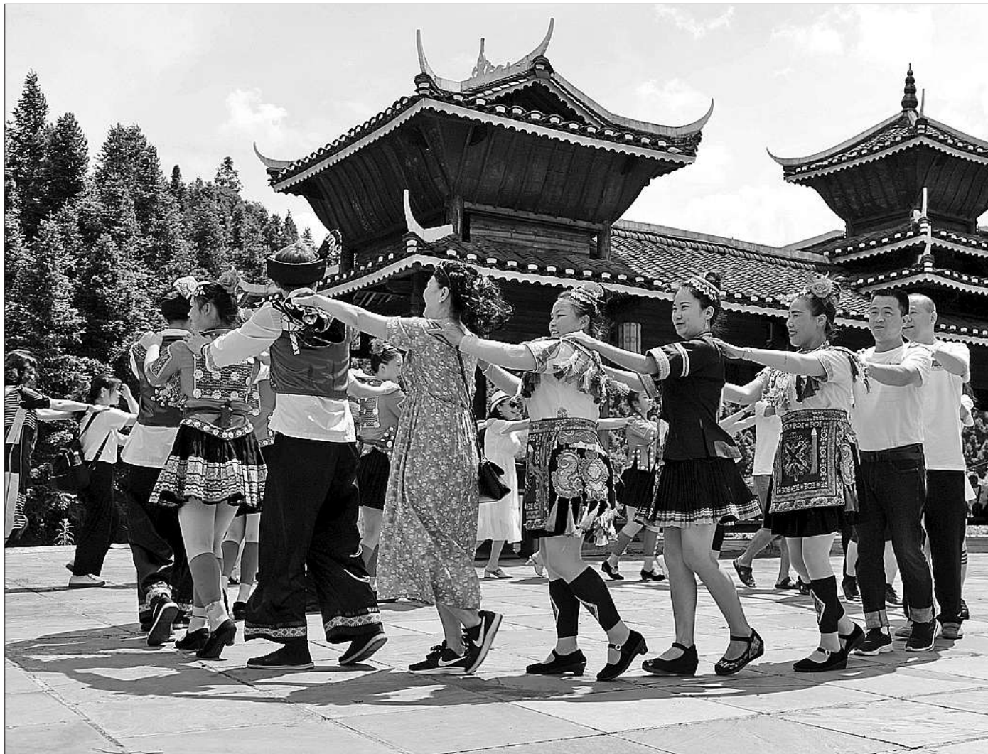
侗寨旅游人气旺 近年来,湖南省通道侗族自治县深入挖掘侗族歌舞、曲艺和民间传说故事,开发了独具民俗特色的皇都室内歌舞演艺,“戎装恋歌”实景演出,“邂逅神秘古侗寨”游园式民俗演出等文化演艺产品,吸引了大批游客前来打卡。图为7月10日,游客在体验“邂逅神秘古侗寨”游园式民俗演出。