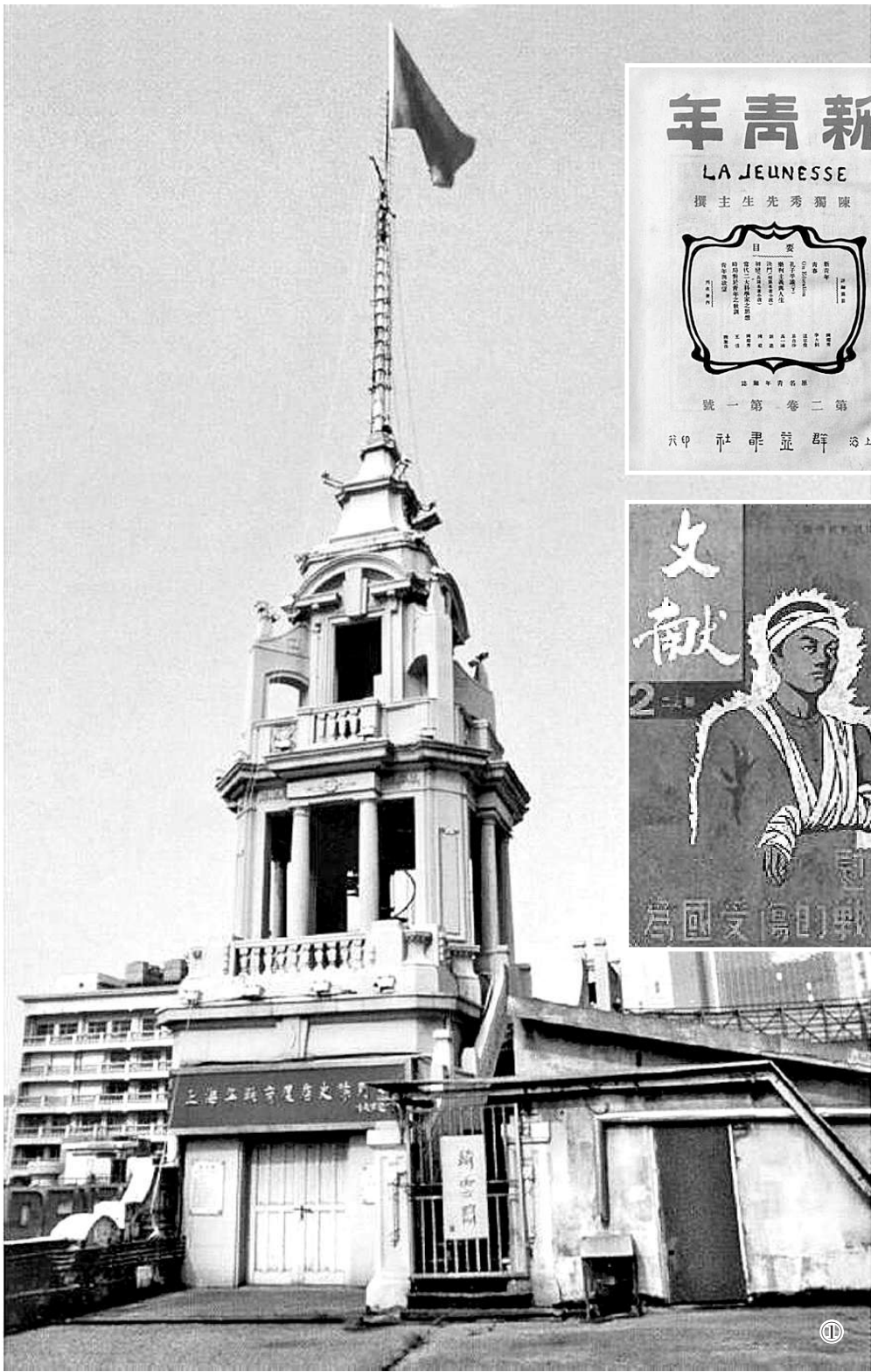
① 绮云阁,上海解放时南京路上第一面红旗升起处。② 《新青年》,1915年9月,陈独秀在上海创办,图为《新青年》第二卷第一号封面。③ 《文献》,八路军驻沪办事处出版的刊物,积极宣传党的抗日主张。