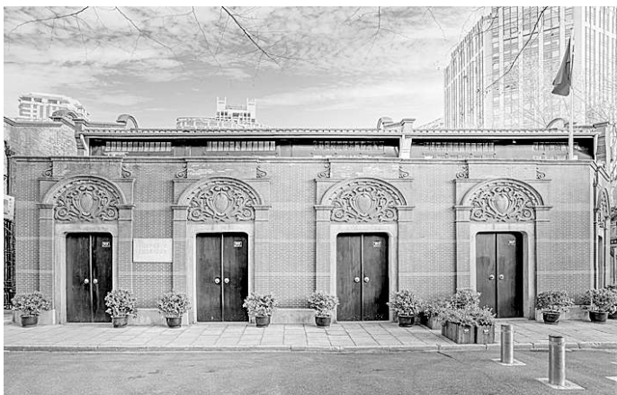
中国共产党第一次全国代表大会会址。本文图片均选自《光荣之城》

时至今日,作者精心挑选的100处革命遗址跨越时空,构成砥砺我们不忘初心、牢记使命的不竭精神动力。这些分布在城市各处的红色遗址,比如唱响“天下工人是一家”口号的中国劳动组