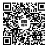
更多视频评论 请扫描二维码

契合。 对不少地方来说,普及中小学生游泳教育,问题不在“必要性”,而在“落地可行性”。让游泳教育进课堂,可能面临场地、师资等局限。但办法总比困难多,问题关键还在于能否足够重视、是否愿意投入。海南要求“2018年,基本完成每个乡镇至少拥有1个游泳池的建设任务”,着力盘活存量游泳馆,就可资借鉴。部分专业人士提到的,学校跟周边游泳馆、俱乐部合作,依托校外游泳馆与外部师资开展游泳教育,也不无参考价值。 对各地而言,加强中小学生学习游泳教育,不是可选项,而是必选项,至于是渐进还是快进,还需地方拿捏好推进节奏。如今,有些省份已先行,其他地方也该跟上。 (作者系媒体评论员)