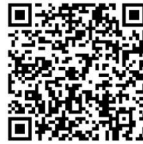
扫描二维码 了解更多内容

“当然也要看到,近期由于国际大宗商品价格上涨,带来PPI(生产价格指数)涨幅明显扩大,原材料价格涨幅领域的价格上涨较快。”付凌晖强调,要加强市场调节,缓解企业的成本压力,促进经济平稳健康发展。