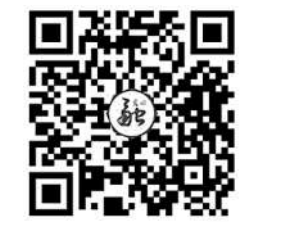
扫描二维码看直播回放

随着安踏集团的直播进入尾声，“2021企业校招招光明大直播”也落下帷幕。自3月31日开播以来，“2021企业校招招光明大直播”共播出16场，走进15家大型企业了解校园招聘，并举办澳门大学生就业与实习专场，共有近20所高校的相关负责人在直播中提供就业指导建议，全网传播量累计突破3300万人次，总观看量累计突破1710万人次，其中光明日报客户端、光明网、kk直播、斗鱼、一直播等平台观看量突破1560万人次。