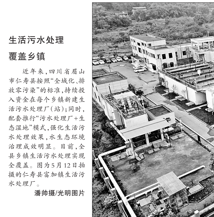
生活污水处理 覆盖乡镇

王晨强调,要深入贯彻落实习近平总书记对甘肃工作和关于中医药工作的重要指示精神,发挥甘肃中医药文化厚重、中药资源丰富优势,健全中医药法规和管理体系,促进中医药守正创新、传承发展,让“千年药乡”焕发新活力。要扶持地道中药材生产基地建设,确保中药材质量。要提升人民群众生活品质,提供高质量中医药服务,为加快建设幸福美好新甘肃作出更大贡献。 在甘期间,王晨到省人大机关调研,参观了八路军兰州办事处纪念馆。