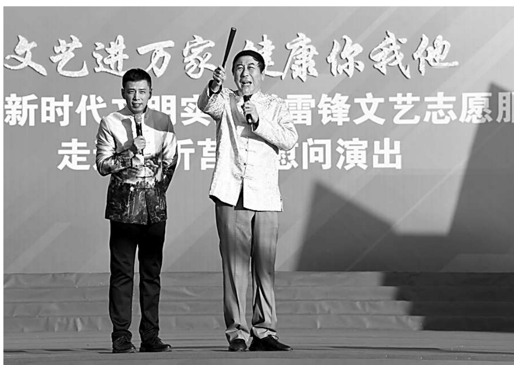
中国文艺志愿者协会主席、相声表演艺术家冯巩(右)在基层开展文艺志愿服务。 新华社发

首先,文艺志愿服务能够助力新时代文明实践中心建设,推动党的创新理论“飞入寻常百姓家”。近年来,通过开展“我们的中国梦——文化进万家”“送欢乐下基层”“到人民中去”“美育圆梦”“百姓春晚”等文艺志愿服务活动,在丰富的文艺形