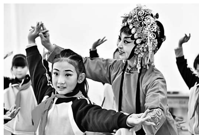
山东省宁津县文艺惠民演出小分队志愿者正在教孩子戏曲表演。

满足人民群众日益增长的精神文化需求,已经成为摆在各级政府面前的重要课题。精神文化需求也是民生问题。如果这方面的需求得不到满足或者没有得到有效引导,容易形成新的社会问题。提升公共文化服务水平,不光要在硬件建设上着力,更重要、更长久的是提升软件即文化内容和文化服务的水平和质量。在这方面,文艺志愿服务具有广阔的发展空间。作为政府开展公共文化服务的有益补充,组织开展文艺志愿服务,能更好地满足人民群众的精