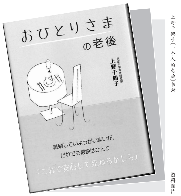
上野千鹤子《一个人的老后》书封

《背叛者》中丈夫默默忍受妻子与自己好友多年的背叛,屈辱终于在一次意外事件中爆发。车祸导致偷情的情人双双瘫痪,丈夫在照料二人的生活中释放仇恨,他折磨两个失去自理能力的人,而这一对情人含情脉脉的对视却将他的妒火和愤恨推向顶点,他一把火烧毁了房子,任妻子与好友葬身火海,多年来心中的羞辱、嫉妒和痛苦随火焰燃烧殆尽,之后他默默走向警局自首。理智之心常常抵不过情感的冲动,人性的脆弱总在矛盾激化的一刻暴露出来。16个故事原型有发生在查科地区的事件,也有受到曼波他乡经历的启发,但它们映射着人类情感的本质和阿根廷社会生活的真相。故事人物经历了爱情、背叛、亲情、悲伤、孤寂和死亡,给读者带来震撼和启示。阅读《永远的查科》中的每个故事,总能引发读者的强烈好奇心,让人紧随情节一探究竟,看似未完的开放式结局又让人浮想联翩。此外,曼波时常以黑色幽默的方式呈现人物命运的悲剧性,故事中的小人物虽然大多遭遇不幸却总能在不幸中寻得尊严,以各自独有的方式对抗不公,小人物身上却充满了力量。或许和故事本身一样,人生本就没有完美结局。曼波这部《永远的查科》就是对人生各个阶段的细致描摹,让读者在字里行间体会人世间的喜怒哀乐。(作者系外交学院讲师)