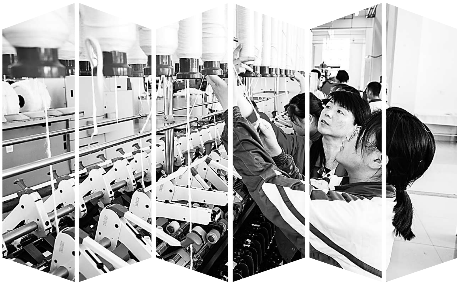
近日,在山东省淄博理工学校纺织、服装实训车间,淄博鲁泰纺织股份有限公司的实习指导教师正在指导学生进行实操练习。目前,该校每年向企业输送200多名职业教育人才,订单招生学员就业率达100%,其中农村学子占95%以上。

全国职业教育大会是在中国共产党成立100周年和“十四五”开局之年召开的一次重要会议,体现了以习近平同志为核心的党中央对职业教育的高度重视,树立了我国职业教育发展史上的又一个重要里程碑