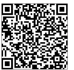
请扫描二维码参与讨论

研究表明,职业教育招生数占比每提高1个百分点,二、三产业吸纳就业的比重上升约0.5个百分点。要继续把发展职业教育作为缓解就业结构性矛盾的关键一招,解决好“技工荒”、大学生结构性就业难、高技能人才供不应求等结构性就业矛盾问题——