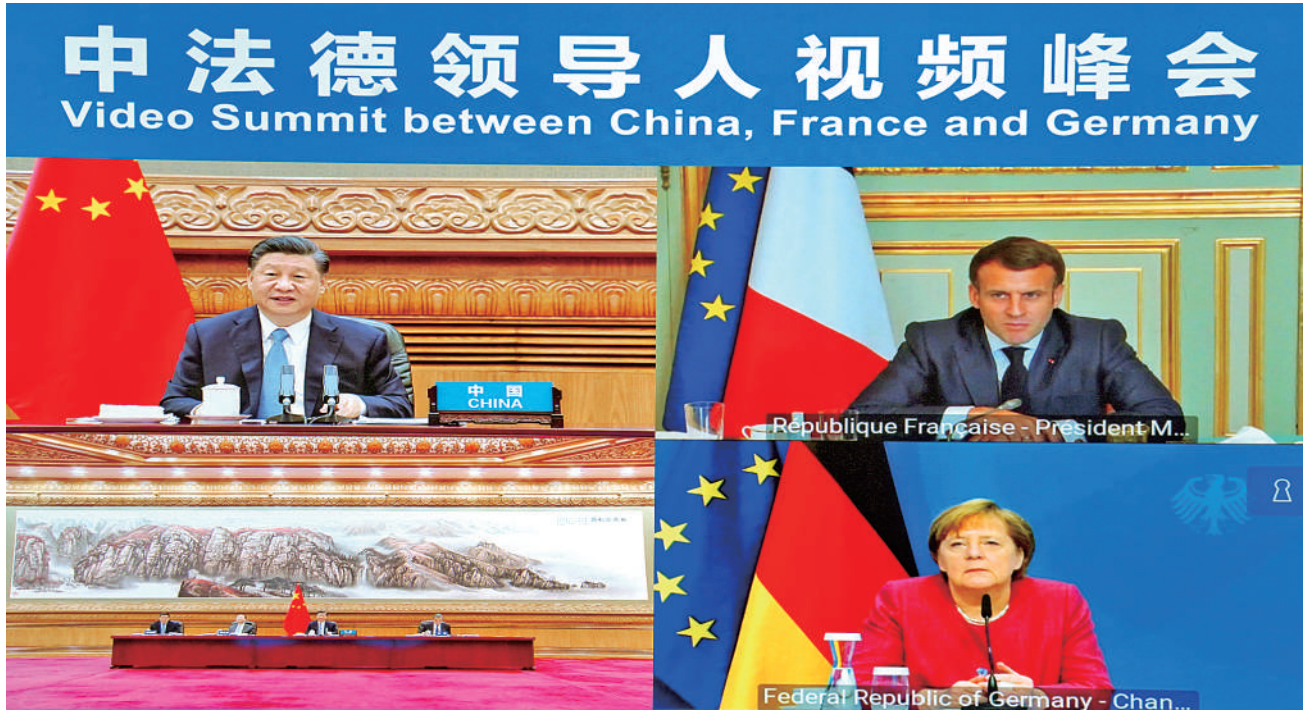
新华社北京4月16日电 4月16日下午,国家主席习近平在北京同法国总统马克龙、德国总理默克尔举行中法德领导人视频峰会。三国领导人就合作应对气候变化、中欧关系、抗疫合作以及重大国际和地区问题深入交换意见。

习近平指出,当前,新冠肺炎疫情仍在全球蔓延,世界经济复苏任务十分艰巨。中欧关系面临新的发展机遇,也面临各种挑战。要从战略高度牢牢把握中欧关系发展大方向和主基调。中方将扩大高水平对外开放,为包括法、德企业在内的外商投资企业营造公平、公正、非歧视的营商环境,希望德方也能以这样的积极态度对待中国企业,同中方一道做大做强中欧绿色、数字伙伴关系,加强抗疫等领域合作。中方反对“疫苗民族主义”,反对人为制造免疫鸿沟,愿同包括法、德在内的国际社会一道,支持和帮助发展中国家及时获得疫苗。中方愿同国际奥委会合作,向准备参加奥运会的运动员提供疫苗。