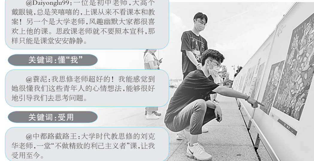
湖南理工学院用艺术展形式为学生上了一堂疫情后特殊的思政课。