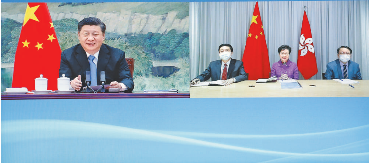
1月27日,国家主席习近平在北京以视频连线方式听取了香港特别行政区行政长官林郑月娥2020年度的述职报告。