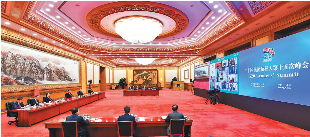
下图:11月22日晚,国家主席习近平在北京以视频方式出席二十国集团领导人第十五次峰会第二阶段会议,重点阐述关于可持续发展问题的看法。

要打造包容性、可持续、有韧性的未来,不断推进全球减贫事业至关重要。面对新冠肺炎疫情冲击,我们比以往任何时候都更需要拿出切实举措。第一,坚持发展优先理念。第二,采取全面均衡政策举措。第三,营造良好国际经济环境