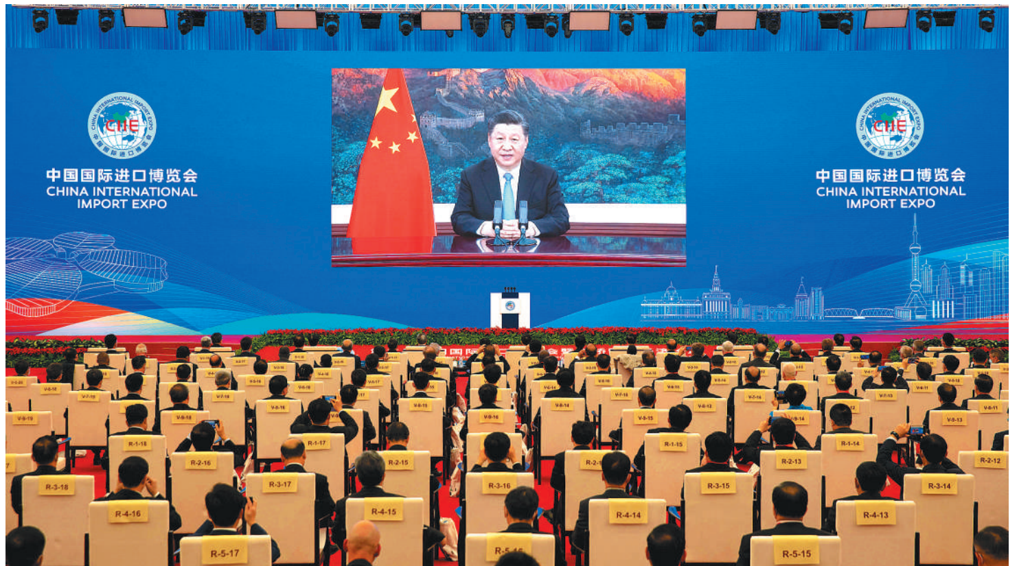
11月4日晚,第三届中国国际进口博览会开幕式在上海举行,国家主席习近平以视频方式发表主旨演讲。

新华社北京11月4日电 第三届中国国际进口博览会开幕式4日晚在上海举行,国家主席习近平以视频方式发表主旨演讲。习近平指出,新冠肺炎疫情使世界经济不稳定不确定因素增多,但中国扩大开放的步伐仍在加快,各国走向开放、走向合作的大势没有改变。各国要携手致力于推进合作共赢、合作共担、合作共治的共同开放。中国将秉持开放、合作、团结、共赢的信念,坚定不移全面扩大开放,让中国市场成为世界的市场、共享的市场、大家的市场,推动世界经济复苏,为国际社会注入更多正能量。 习近平指出,本届进博会是在特殊时期举办的。突如其来的新冠肺炎疫情给各国带来严重冲击,也给世界经济带来重创。中国在确保防疫安全前提下如期举办这一全球贸易盛会,体现了中国同世界分享市场机遇、推动世界经济复苏的真诚愿望。 习近平强调,尽管受到疫情影响,今年中国扩大开放的步伐仍在加快。我在第二届进博会上宣布的扩大对外开放系列举措已经全面落实。中国持续扩大进口。海南自由贸易港建设总体方案、深圳进一步扩大改革开放的实施方案发布实施,商签高标准