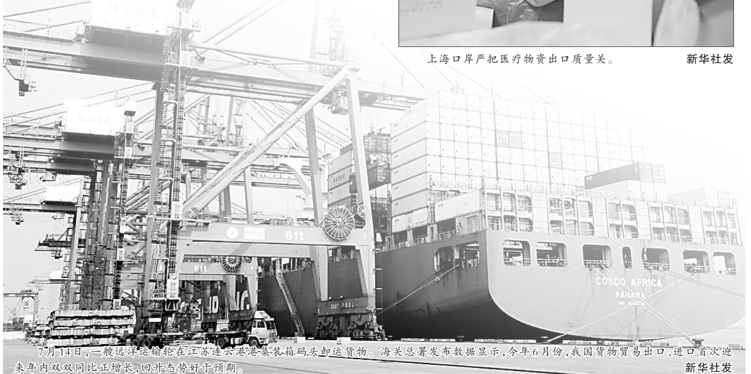
7月14日,一艘远洋运输轮在江苏连云港港集装箱码头卸运货物。海关总署发布数据显示,今年6月份,我国货物贸易出口、进口首次迎去年内双双同比增长,回升态势好于预期。 新华社发

为了实现上述使命与愿景,哥斯达黎加大学海关管理及对外贸易专业从道德、责任与知识三个层面设定了三条人才培养原则。其一,倡导与条约和国际协定规定的义务相一致的公共责任的基本道德价值。其二,促进国家海关和对外贸易体系的发展,以满足国家、私营部门和区域国家实体的要求。其三,为学生提供多学科训练。