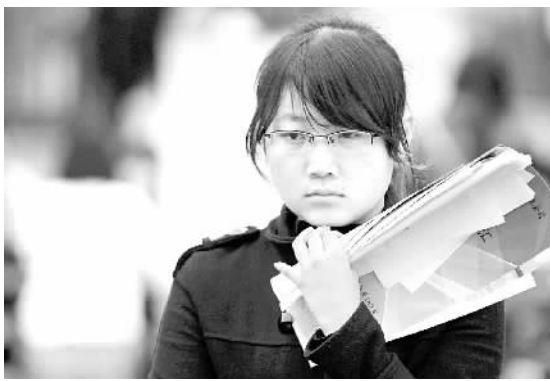
一名求职者在南京江宁大学城大学生露天招聘会现场观看招聘单位信息。

“立体化校园招聘人才市场,满足了不同学科专业毕业生的就业需求,让毕业生能够在多个岗位中择优就业,以综合性供需洽谈会为例,学校每年在11月、12月及次年3月如期举行,每场有3000多家大中型企事业单位提供7000余个需求岗位。”江苏大学党委书记范明说。