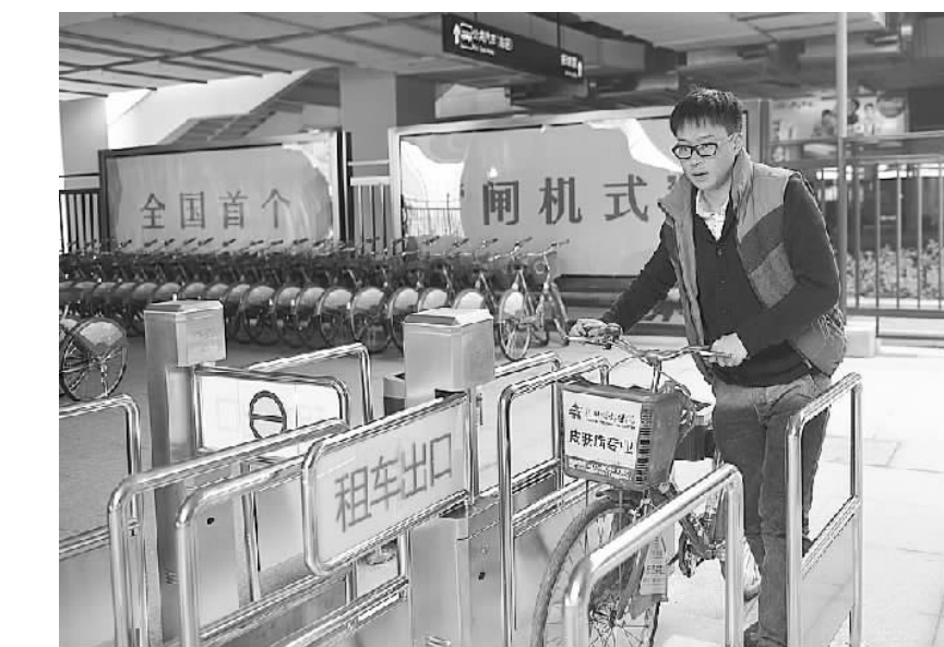
杭州推出首个“闸机式”快速租还公共自行车服务点 2月21日,杭州首个“闸机式”快速租还公共自行车服务点在杭州铁路东站投入使用。图为一名市民在杭州铁路东站的闸机式公共自行车服务点租用自行车。