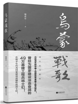
《乌蒙战歌》樊希安著，江苏凤凰文艺出版社2019年5月出版，定价65.00元

《乌蒙战歌》是樊希安先生的第一部长篇小说，也是国内描写上世纪“大三线”工程建设的第一部小说。