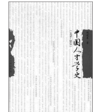
《中国人才学史(1979—2015)》侯建东著,同济大学出版社出版,定价128.00元

人才学肇始于我国20世纪70年代独创的一门学科,深深地打上了中国特色的烙印,是不折不扣的起源于斯、成于斯的中国智慧。人才学在中国产生与发展的历史虽然不到40年,然而其国内外影响、当代贡献以及巨大潜力却远远超出人们当初的预估。作者站在历史的高度,对中国人才学史进行深刻而全面的诠释,老一辈人才学家筚路蓝缕开拓人才学学科,中青年人才学家后继有人。作者不仅从人才学史的角度概括和诠释了人才学发展的线索,而且还