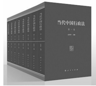
《当代中国行政法》(第二版),应松年主编,人民出版社2018年5月出版,定价720.00元

近年来,如火如荼的新公共管理运动,无论中国还是境外,对行政法学的理论及其体系带来了前所未有的冲击,“新行政法”“新概念行政法”等在行政法学界声音越来越响亮。然而,遗憾的是,究竟该如何构建新行政法或新概念行政法学科体系,学术界尚未形成共识。《当代中国行政法》(第二版)在总体上保持自治的理论体系的基础上,努力深化行政法学科体系,如丰富和细化行政组织法、行政程序法编的内容,使其能与行政行为、行政监督与行政救济法两编相匹配。同时,《当代中国行政法》(第二版)力图反映公共管理和中国行政法学的最新发展,如设专章分析国有财