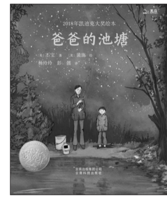
《爸爸的池塘》,[美]丕宝著,[美]裴施绘,杨玲玲、彭懿译,云南科技出版社2018年9月出版,定价68.00元