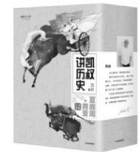
《凯叔讲历史》,中信出版集团