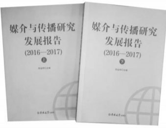
《媒介与传播研究发展报告(2016—2017)》,张金桐主编,吉林大学出版社2017年12月出版,定价96.00元

新的时代,新闻传播技术的发展日新月异,新闻传播环境也从以前的以传者为中心向人人皆传者的媒介社会转变。这个时代,新闻传播与现实生活日益融为一体,媒介面临着机遇与挑战。对于新闻传播业而言必须对当前新闻传播发展现状有一个全面而深刻的认识。因此,《媒介与传播研究发展报告(2016—2017)》一书的出版显