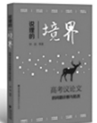
《说理的境界:高考议论文的问题诊断与批改》,钟斌著,福建教育出版社2017年12月出版,定价44.80元