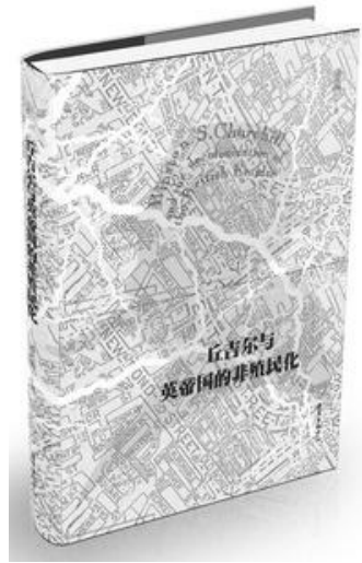
《丘吉尔与英帝国的非殖民化》,潘兴明著,东方出版中心2018年1月出版,定价45.00元

一书让读者看到多面的丘吉尔,他既有强烈的帝国抱负和深厚的帝国情感的一面,也有在治国理政过程中,具有政治灵活性,顺应历史潮流的一面。从这个角度而言,《丘吉尔与英帝国的非殖民化》一书让读者对历史人物丘吉尔个人形象的理解超越了二战中的英雄气概,变得更加饱满。