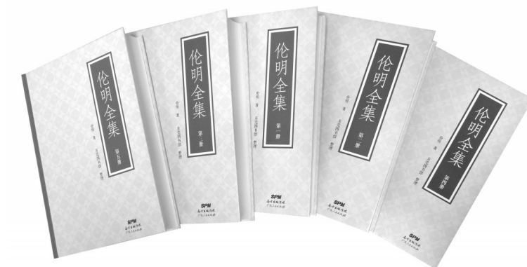
《伦明全集》(全五册),伦明著,东莞图书馆整理,广东人民出版社2017年12月出版

其次,为图书馆深入开展地方文献工作提供了一条可供借鉴的路径。《伦明全集》从立项、资料蒐集、