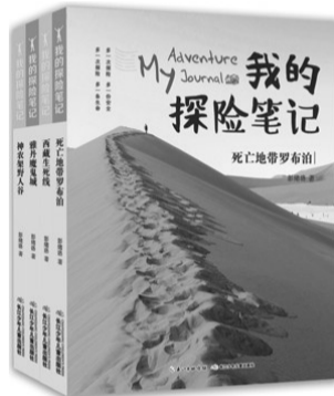
“我的探险笔记”系列(四册),彭绪洛 著,长江少年儿童出版社2017年10月出版,定价28元/册