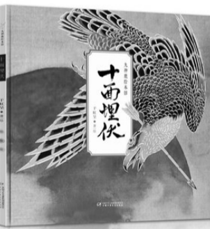
《十面埋伏》,于虹 著绘,中国少年儿童出版社2017年5月出版,定价46元

今天,我们已不再担忧互联网的发展取代纸质阅读,因为,捧读一本精心打造的图书,它所带来的