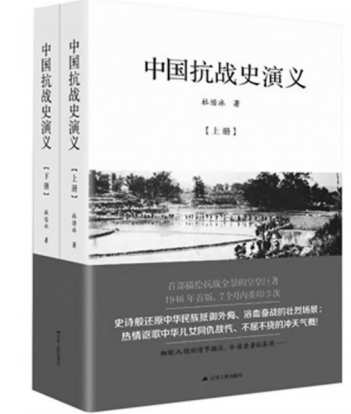
《中国抗战史演义》（上下），杜惜冰著，江苏人民出版社2017年7月第一版，128.00元

江苏人民出版社本次再版，所据版本为东方书店1947年4月版。原书中涉及人名、地名、计量单位、统计数字、标点符号、语言表达方式等等，多有不规范和不尽统一处，但鉴于此书是一部民国时期的文学作品，具有浓厚的民国韵味，为尊重作品历史原貌，未作改动和刻意修正，仅对少量明显的排印讹误略作修改。另外，书中还存在一