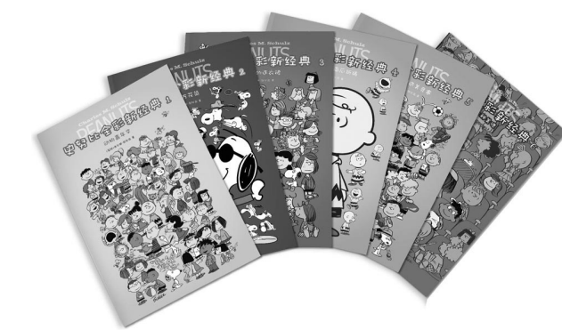
《史努比全新经典》（1-6），江苏凤凰文艺出版社2017年7月第一版，29.80元/册

不难发现，史努比身上还具备了一种洋溢着人艺术气息又乐观自信的生活态度。与同类动物明星相比，史努比不会说话只会思考，没有超能力，不是英雄，只会空想。作为一条狗，原本只需尽到看家护院陪人玩耍的本分，但史努比无视这些，他觉得自己生来平等自由，有自己的生活目标，他每天趴在狗屋上的光阴都不是虚度的，他每天最重要的日程就是端坐或趴在狗屋屋顶上，他在认真思考人生真谛，为自己的“人生”做着规划（或白日梦），他幻想自己是一战时期的王牌飞行员，与假想敌“红男爵”斗智斗勇；幻想自己是大作家，不停在脑中整理最优雅的创作词句；它善于思考，也采纳意见，经常崇拜自己所想出的“点子”。因此，可以说，史努比看似与大家同在，其实他还是喜欢陶醉在自己的世界里（这一点也和《生活大爆炸》里的自负的天才谢耳朵异曲同工）。作者舒尔茨在解释史努比这个角色时说道：“史努比为了生活需要逃避到自己的幻想世界里，不然它只能过着单调又悲惨的日子。狗的生活不是好过的”。在角色背景上，史努比不是娇生惯养的名犬，它出生后就被迫和家人分离，最初的主人是一名叫莱拉的女孩，但由于搬家，无法继续饲养而被史努比遗弃在雏菊山小狗农场，直到后来史努比