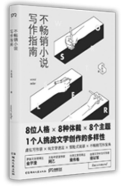
《不畅销小说写作指南》,大头马 著,湖南文艺出版社2017年7月出版,定价48元

而选择意味着责任。由此,我必须也只能有一种谦卑的方法回答这个题目,我是这本小说集的作者,也只能是这本小说集的作者。