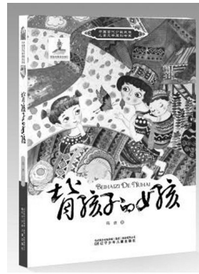
《背孩子的女孩》,玛波 著,辽宁少年儿童出版社2017年3月出版,定价35元

贫困的广大山区、“老少边穷”地区,“沃仑阿龙”们的处境并没有根本改善,在某种尺度上,“沃仑阿龙”是第一代,也许稍早时期的“留守儿童”。只是今天有今日“辛酸的味道”,亲情多有破裂,甚至“我背着你你背着我”的相依相存的情感也会淡化,但我相信它的存在,我们不应当拒绝面对孩子的责任、理解,还有忧伤和辛酸。