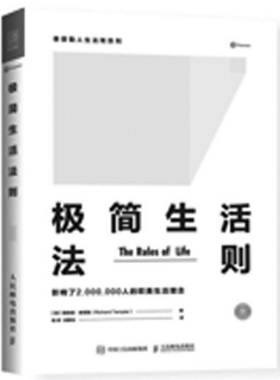
《泰普勒人生法则系列》(5册),[英]理查德·泰普勒 著,人民邮电出版社2017年8月出版,定价49元(每单本)

领域成功人士的细致观察,他发现有些人总是看起来生活得很轻松,无论身处何种状况,他们总是能够积极向上,做正确的事情,不可否认,大家都喜欢这样的人,也都希望成为这样的人。于是,他将自己所观察到的一切总结成一条条简单的法则,分享给了每一位想从容应对生活的人。