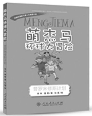
《普罗米修斯计划》,肖叶、周鹿著,杜煜绘,人民教育出版社出版,定价25元

“萌杰马环球大冒险”更是展现当代中国儿童的形象。随着中国经济的腾飞,越来越多的中国孩子在小时候就走出国门,去世界探索,在各种文化的交流碰撞中成长。未来的中国需要像三位主人公一样的国际人才,把工厂开到全世界,把生意做到全世界,他们需要熟悉各国文化,了解国际规则,这套书就是把各个国家的历史、文化、风土人情等知识融合在一起,孩子们在书中获得探索世界的勇气。中国孩子的传统形象是很“乖”“很听话”,缺乏冒险意识和探索精神。这套书展示的中国孩子自信、阳光、正义、勇敢、敢于承担。冒险并不等于莽撞,而是需要