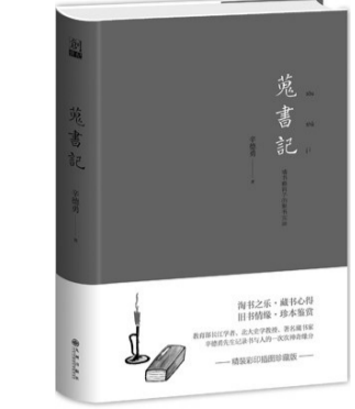
《蒐书记》,辛德勇著,九州出版社2017年1月第一版,68.00元

书。他说:“所有的收藏,都是在收藏历史,而书籍所蕴涵的历史信息,最为丰富,也最为明晰准确,远胜于其他各类历史资料。”他认为藏书的意义,“并不只是收藏多少书籍这一结果,更重要的是通过四处搜罗、精心别择而得到心爱的书籍的过程。只有有书籍而没有这种收藏过程的人,家里存书再多,甚至有再多珍本善本,也根本谈不上藏书,只能说是获得或是拥有书籍”。