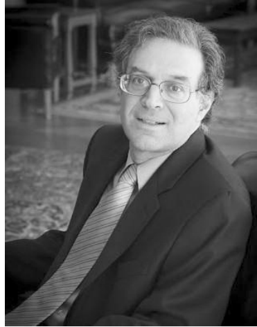
左：彭慕兰；右：《大分流：欧洲、中国及现代世界经济的发展》，[美]彭慕兰著，史建云译，江苏人民出版社2016年4月版，49.00元

英国背后是整个欧洲文明，或曰地中海文明。从幼发拉底河、底格里斯河的两河文明到巴尔干半岛的希腊文明，到亚平宁半岛的罗马帝国，再到伊比利亚半岛葡萄牙、西班牙的航海先行者，从地理上看是沿着地中海边沿逆时针旋进，从时