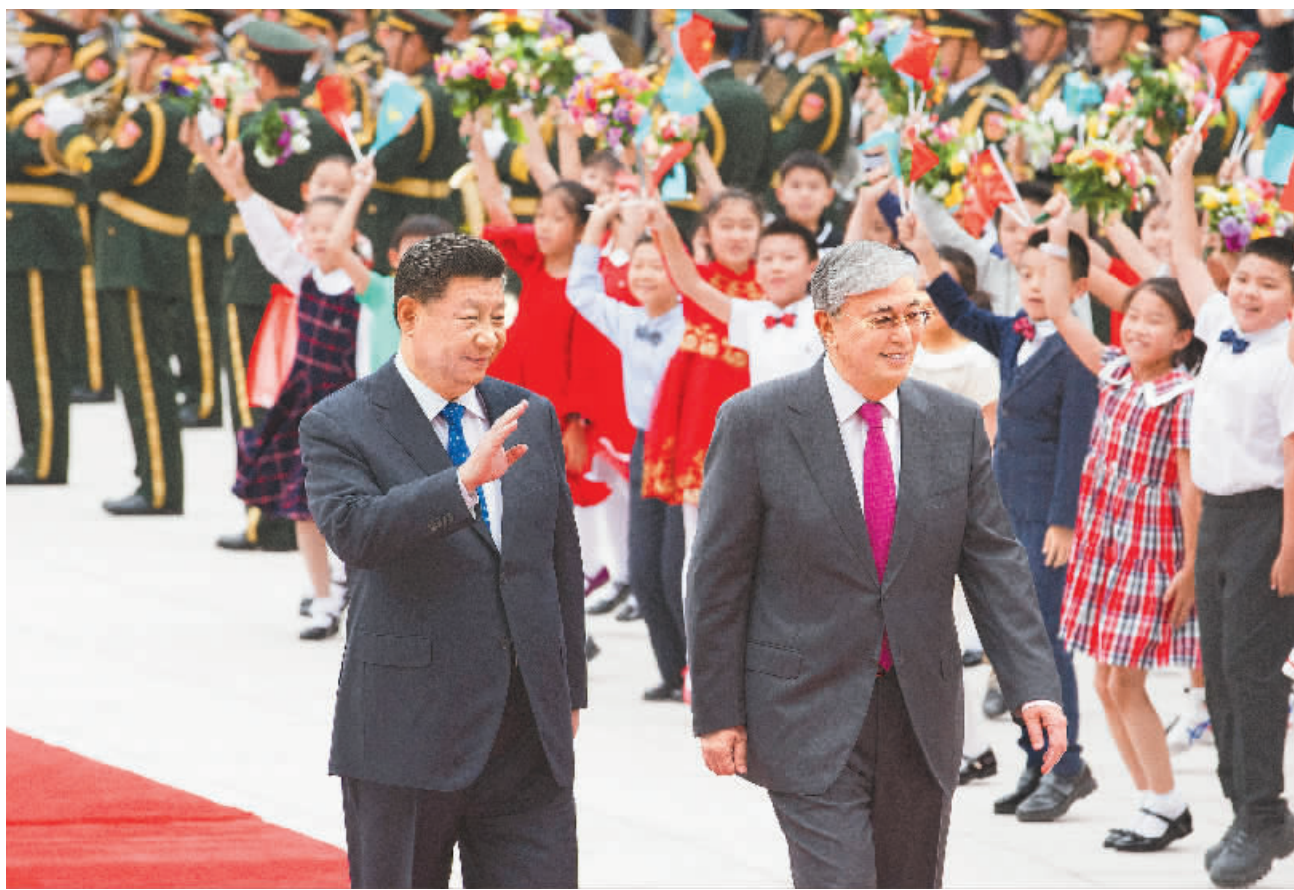
9月11日,国家主席习近平在北京人民大会堂同哈萨克斯坦总统托卡耶夫举行会谈。这是会谈前,习近平在人民大会堂东门外广场为托卡耶夫举行欢迎仪式。

新华社北京9月11日电(记者孙奕)国家主席习近平11日在人民大会堂同哈萨克斯坦总统托卡耶夫举行会谈。两国元首一致决定,双方将本着同舟共济、合作共赢的精神,发展中哈永久全面战略伙伴关系。习近平说,再过十几天,我们将隆重庆祝中华人民共和国成立70周年。70年来,中国共产党带领中国人民取得举世瞩目的伟大成就,正朝着实现中华民族伟大复兴的目标迈进。这一进程从来都不会一帆风顺,但无论外部形势如何变化,中国都将坚定不移、心无旁骛地做好自己的事,全面深化改革,扩大对外开放,推动实现更高质量发展。我们完全有能力应对好各种风险挑战,任何艰难险阻都阻挡不了我们前进的步伐。一个稳定、开放、繁荣的中国将始终是世界未来发展的机遇。习近平指出,中哈关系是睦邻友好