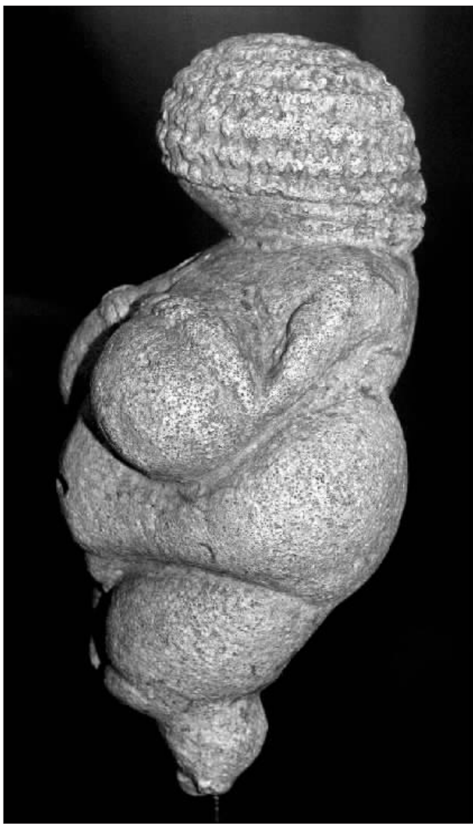
威冷道夫的维纳斯

于对迈锡尼王宫遗址的发掘和研究而闻名遐迩,他在全面调查研究了基克拉底古墓群后,为这个新发现的文明命名为“基克拉底文明”。由于该地区的有利地理位置,基克拉底群岛一度控制爱琴海贸易的海上霸权。而活跃的商贸活动也为该地区居民带来巨