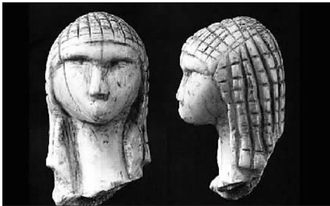
法国国家博物馆的维纳斯

大的臀部暗示其与生育力、创造力有关。凸起的双目、高挺的鼻梁之外,繁复的发型也引人注目,精致的盘发或缀满头饰的披发代表了当时流行的风格。虽然无法给这类雕像一个明确的名字,但无疑它是新石器时代“维纳斯雕像”风格的延续,是“具有某种宗教意义的女性雕像”,广泛流行于公元前5000年到公元前2700年之间的南亚。