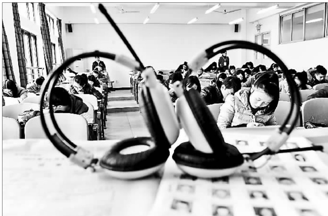
大学英语考试考场一景。

习近平总书记在全国教育大会上指出,要提升教育服务经济社会发展能力,调整优化高校区域布局、学科结构、专业设置,建立健全学科专业动态调整机制,加快一流大学和一流学科建设。在新时代新形势下,外国语言文学学科的学科定位和内涵需要及时调整和转变。一方面,要不断拓展外国语言文学学科新内涵。