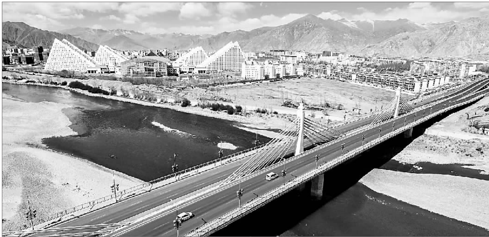
西藏立体交通网络展新颜

“八字方针”有哪些新内涵、新要求?今后深化供给侧结构性改革、推动经济高质量发展,应如何贯彻好“八字方针”?记者就此采访了相关专家学者。