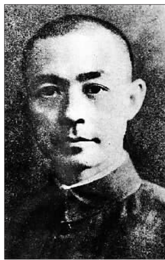
张自忠像

新华社济南12月6日电(记者邵琨)张自忠是从山东临清唐园村走出的著名抗日爱国将领。他年少时弃学从戎,自1914年至1940年的20多年里,多次临危受命,奋勇杀敌,最终战死沙场,以身殉国,为后世所敬仰。