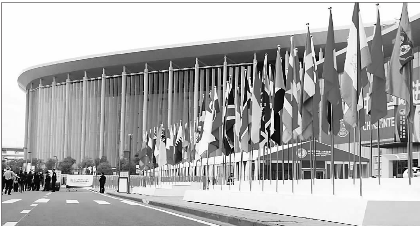
首届中国国际进口博览会日前在上海举行。

扩大进口,不仅仅意味着消费者可以更好地“买全球”,更意味着中国经济发展迎来新的动力和引擎,也让人们看到中国愿与世界共享发展机遇的自信和担当。