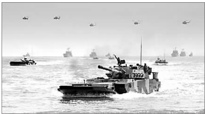
中部战区陆军某部在福建某地组织合成步兵营登陆战术检验演训。

改革创新、与时俱进,是人民军队不断发展壮大的根本动力,也是永远立于不败之地的关键要素。从“古田会议”奠定“思想建党、政治建军”,抗日战争时期调整体制编制;到新中国成立后,多次调整体制编制;从红军时期“十六字诀”、抗日战争时期“持久战”、解放战争时期“十大军事原则”,到新时代改革强军的伟大实践,都体现了我军勇于革新、进取创新的精神特质。军队建设发展的出路在改革创新,动力也在改革创新。建设世界一流军队,必须大力弘扬创新文化,营造创新氛围,引领官兵将创新理念贯穿到部队建设方方面面,以改革创新的思路举措破解矛盾问题,推动我军由大向强发展。