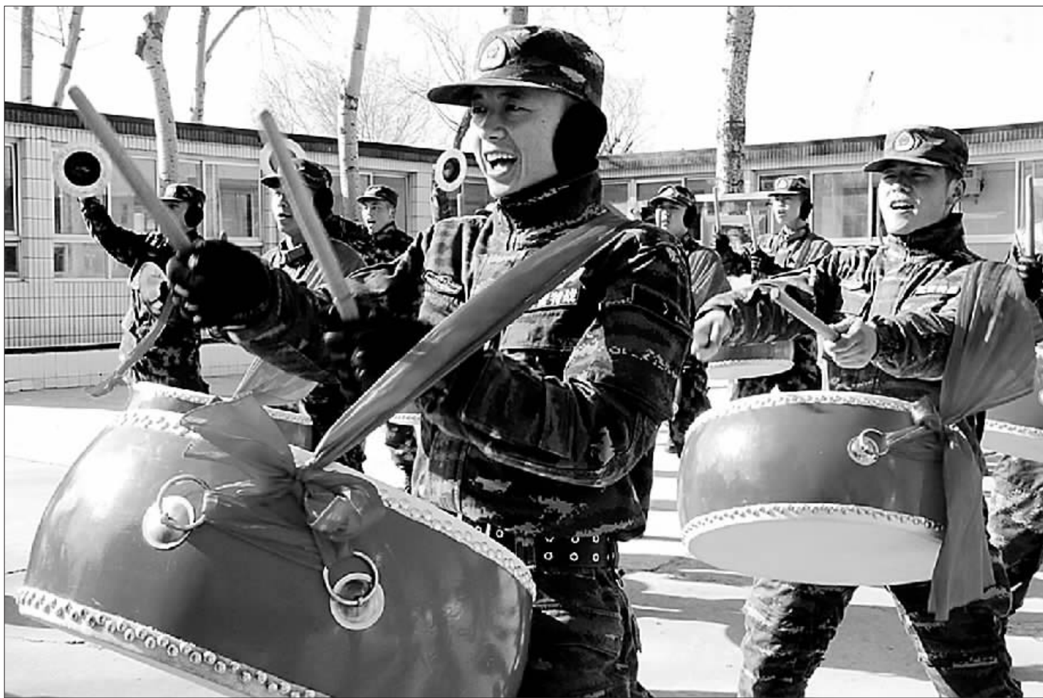
武警北京市总队执勤第十支队官兵进行特色文艺分队训练——“威风锣鼓”。

实现伟大梦想必须凝聚中国力量,这就是中国各族人民大团结的力量。习主席强调指出,只要我们紧密团结,万众一心,为实现共同梦想而奋斗,实现梦想的力量就无比强大,我们每个人都为实现自己梦想的努力就拥有广阔的空间。在民族百年复兴历程中,强军文化总是以全官兵的现实表现为载体,在国家危急时刻和紧要关口,他们是主动担当支撑命运、扭转乾坤的民族脊梁,是凝聚民族意志、催生中国力量的坚强柱石。同时,人民军队创造的军事文艺理直气壮、昂扬主旋律,用各种形式讴歌人民、昭示光明、凝聚人心,体现了思想性、战斗性和艺术性兼具的鲜明特征,其所产生的巨大精神价值浸润、影响、塑造着中华民族的灵魂,持续凝聚起中华民族不可战胜的磅礴力量。