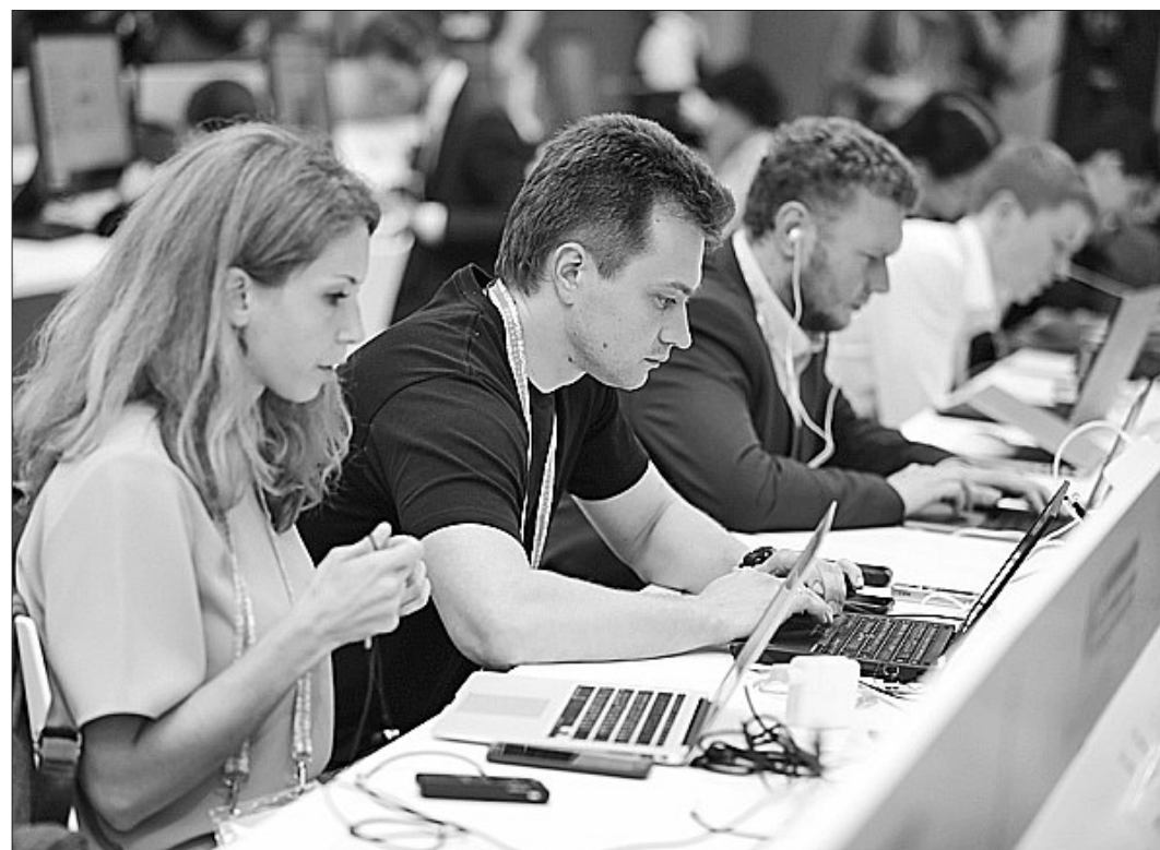
6月9日,中外媒体聚焦上海合作组织青岛峰会,上合青岛峰会新闻中心一片忙碌景象,随处可见中外记者忙碌的身影。

的参与者和当今充满不确定性国际局势中一极重要的稳定力量。“和合上合”——“上海精神”与中国传统文化精髓中的“和合”文化理念高度契合,超越了文明冲突、冷战思维及零和博弈等陈旧观念,已经成为上合组织的思想内核。可以说,“上海精神”不仅阐明了不同类型的国家交流合作应当遵循的基本准则,而且超越了西方的国际关系理论的固有范式,创新了国际关系理论。