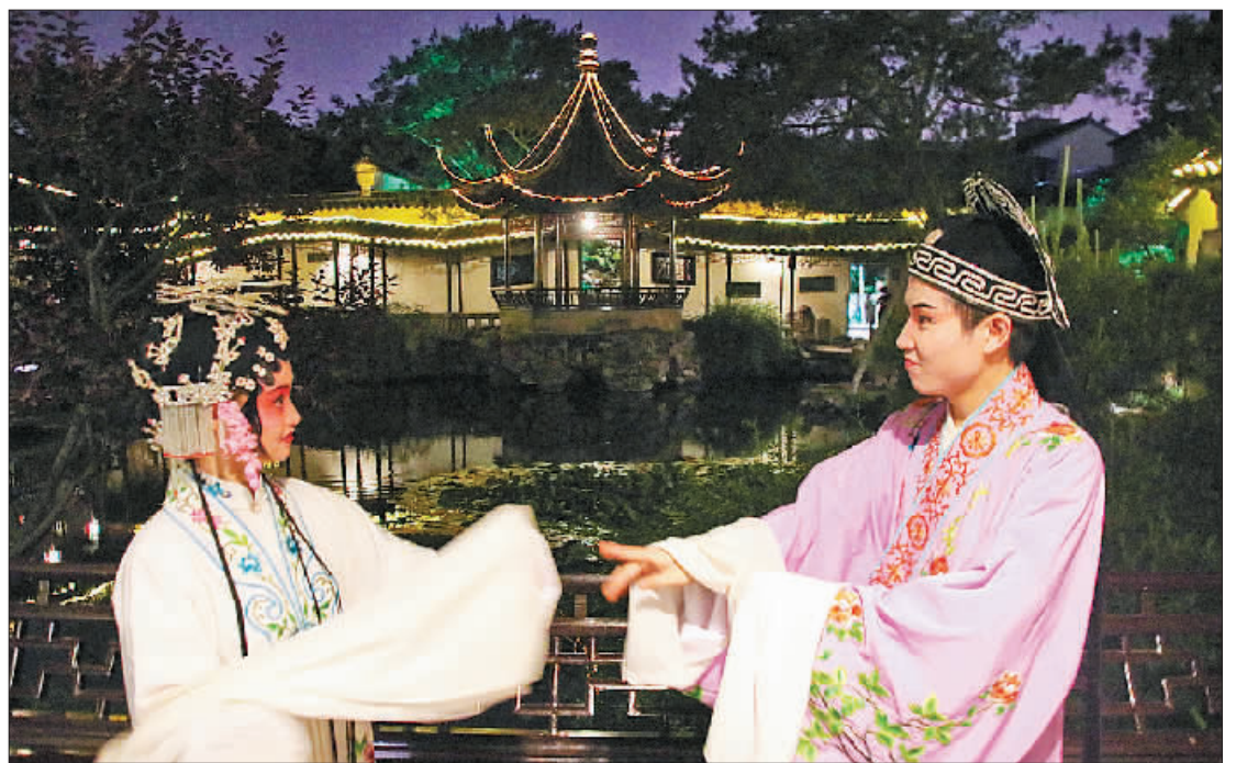
苏州网师园特色夜游醉游人 5月15日晚,苏州古典园林网师园开放特色夜游活动。园内8个厅堂、楼台景点分设昆曲、评弹、古琴、民间歌舞、民族乐器等颇具地方传统特色的表演。图为演员在苏州网师园表演昆曲《游园惊梦》。 王建康摄/光明图片