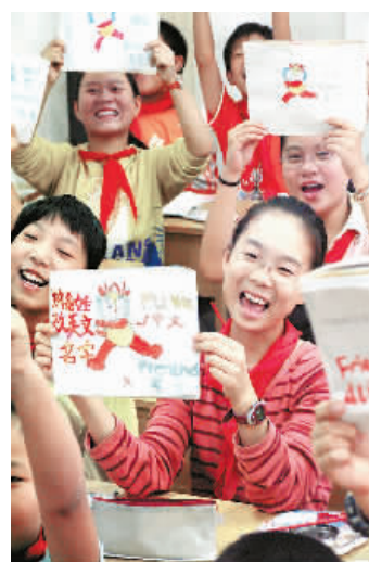
2006年，北京奥组委把“福娃”的国际译名由“Friendlies”改为汉语拼音“Fuwa”后，安徽淮北的小朋友画起了“福娃”。