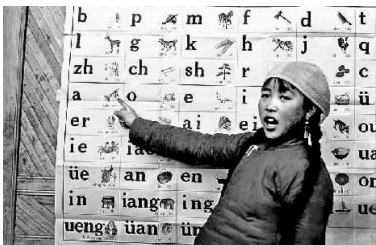
1960年，山西陵川的孩子学习汉语拼音。

“一带一路”建设需要语言铺路，同样，构建人类命运共同体也需要语言铺路。开展汉语教学实质上是“开展‘国际理解教育’”，“造就国际社会情感的沟通”。因此，开展好