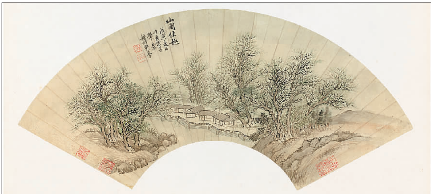
《山园佳趣》 王冕 约1698年 波士顿美术博物馆藏

从毕达哥拉斯时代起,数学家们就在反复思考数学真理的本质、数学实体的本体论、证明有效性的原理等问题。一直到19世纪中叶,流行的科学观念都是把数学看作是通达最终的、绝对的、完全独立于人类认知活动和理解能力的真理的唯一途径。然而,到了19世纪,由于非欧几何的出现,“不证自明”的公理的论证遭到了强烈的反对。肇始于古希腊芝诺悖论的无穷数学处理问题,也随着微积分和无穷集合的出现而被重新提了出来。数学到底能不能建立在逻辑的基础之上,这成为当时数学基础研究领域需要着重加以探讨的问题。 以罗素、弗雷格、皮亚诺、康托